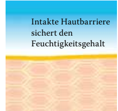
Intakte, schützende Hautbarriere mit Linolsäure-reichen Lipiden.

Linola Hautmilch, Linola Gesicht, Linola Hand und Linola Fuß-Milch sowie zu weiteren Linola-Produkten bei verschiedenen Hautproblemen bereitgestellt.