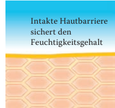
Intakte, schützende Hautbarriere mit Linolsäure-reichen Lipiden.

Besuchen Sie uns unter www.linola.com . Denn dort haben wir für Sie alle aktuellen Informationen über Linola Hautmilch , Linola Gesicht , Linola Hand und Linola Fuß-Milch sowie zu weiteren Linola-Produkten bei verschiedenen Hautproblemen bereitgestellt.