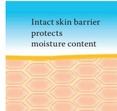
Intact protective skin barrier with lipids rich in linoleic acids.

Visit us at www.linola.com and select the drop-down menu "country". Here you will find all the latest information on Linola Lotion, Linola Face, Linola Hand and Linola Foot Lotion as well as other Linola products for a wide range of skin problems.