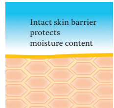
Intact protective skin barrier with lipids rich in linoleic acids.

That's why, Linola offers a range of special products which have been developed to be used together and which are ideal for the body, head, face, hands and feet. Visit us at www.linola.com and select the dropdown menu "country". Here you will find all the latest information on Linola Lotion, Linola Face, Linola Hand and Linola Foot Lotion as well as other Linola products for a wide range of skin problems.