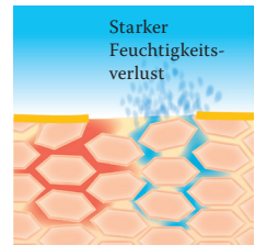
Lipidverlust führt zu einer gestörten Hautbarriere: Die Haut verliert viel Wasser und trocknet aus.