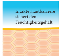
Intakte, schützende Hautbarriere mit Linolsäure-reichen Lipiden.

Besuchen Sie uns unter www.linola.com , denn dort haben wir für Sie alle aktuellen Informationen über Linola Hautmilch , Linola Gesicht , Linola Hand und Linola Fuß-Milch sowie zu weiteren Linola-Produkten bei verschiedenen Hautproblemmen bereitgestellt.