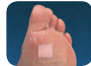
Abb. 1: Normalbefund – rosa

Ist das Reaktionsfeld komplett rosa verfärbt, sind Zustand und Schutzfunktionen der Haut intakt. (Wiederholen Sie den Test in 6 Monaten)