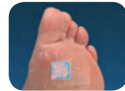
Abb. 3: Störung – marmoriert

Ist das Reaktionsfeld unverändert blau, liegen Störungen der Hautschutzfunktionen vor. Die Haut ist (zu) trocken, unelastisch und mechanisch nicht ausreichend belastbar. Diesen Befund sollten Sie Ihrem Arzt mitteilen. (Bitte begeben Sie sich für weitere Untersuchungen in ärztliche Behandlung)