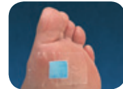
Abb. 2: Störung – blau

Ist das Reaktionsfeld komplett rosa verfärbt, sind Zustand und Schutzfunktionen der Haut intakt. (Wiederholen Sie den Test in 6 Monaten)