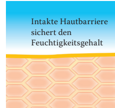
Intakte, schützende Hautbarriere mit Linolsäure-reichen Lipiden.

Besuchen Sie uns unter www.linola.de . Denn dort haben wir für Sie alle aktuellen Informationen über Linola Hautmilch , Linola Gesicht , Linola Hand und Linola Fuß-Milch sowie zu weiteren Linola-Produkten bei verschiedenen Hautproblemen bereitgestellt.