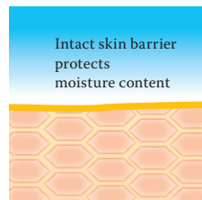
Intact protective skin barrier with lipids rich in linoleic acids.

Visit us at www.linola.de and select the dropdown menu "country". Here you will find all the latest information on Linola Lotion , Linola Face , Linola Hand and Linola Foot Lotion as well as other Linola products for a wide range of skin problems.