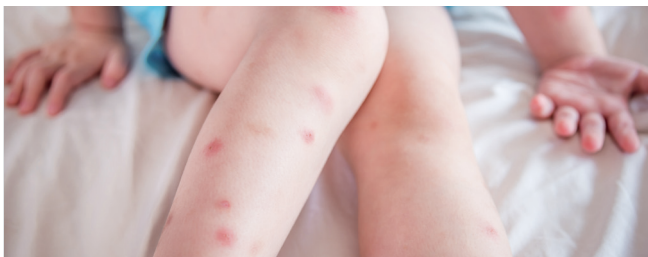
Das mit typischen Hauterscheinungen und Symptomen einhergehende Krankheitsbild, das durch den Stich von Bettwanzen hervorgerufen wird, bezeichnet man als Cimikose.

Sie ist vorzugsweise in Bettritzen, Matratzen, Kissen und Plüschtieren beheimatet – aber auch hinter Tapeten, Fußleisten, auf Kleidung oder in Teppichen ist sie anzufinden.