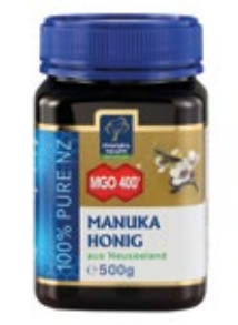
MGO 400+ (500 g)