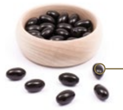
TÄGLICH 4 KAPSELN EINNEHMEN