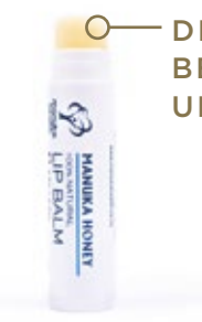
DER IDEALE BEGLEITER FÜR UNTERWEGS