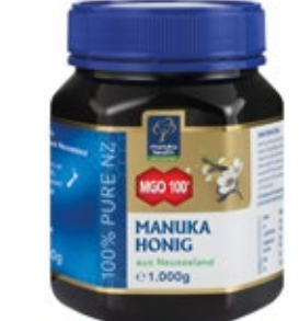
MGO 100+ (1 kg)